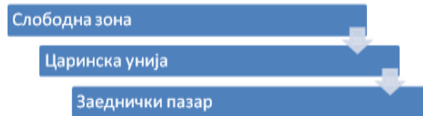
Слика бр. 3-2. Видови на регионални интеграции